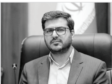
معاون هماهنگی امور گردشگری و زیارت استاندار فارس:

لازم به ذکر است که با احداث این پروژه مردم شهرستان داراب از برق مطمئن و پایدار بهره‌مند خواهند شد.